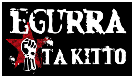
EGURRA TA KITTO